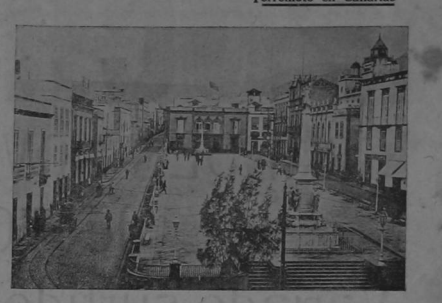
Capital de Canarias... Plaza de la Constitución y Calle del Comercio.