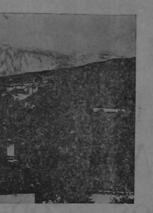
Volcán de Teide... Erupción...