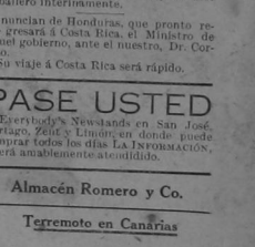
Almacén Romero y Ca.